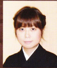
箏 板橋 雅楽美美