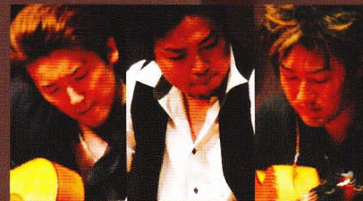
フラメンコギター DON ALMAS