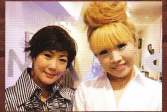
ポップス 美聖、まり