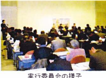
実行委員会の様子

詳細については、まだ詰める事も多々ありますが、区民の皆様、観光客の皆様にも、喜んで頂ける一大イベントです。無事故で素晴らしいお祝いになる様に、最大限努力を積み重ねて当日を迎えたいと思っています」とのお話です。