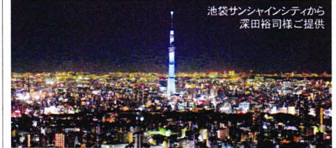
池袋サンシャインシティから

昨年(2012)の5月22日(火)にすみだ中の人々が待ちに待っていた、世界に誇る新しいシンボルとなる東京スカイツリーが開業一周年になります。