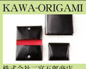
株式会社二宮五郎商店