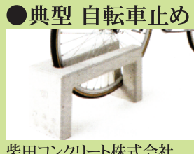
柴田コンクリート株式会社