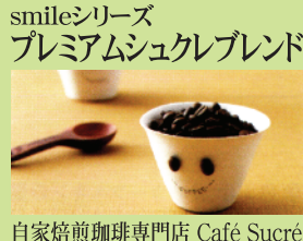
自家焙煎珈琲専門店 Café Sucre