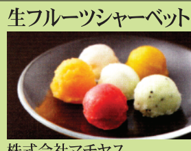
株式会社マチャス