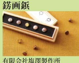
有限会社塩澤製作所