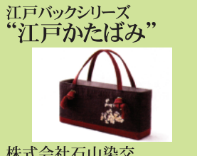
株式会社石山染交