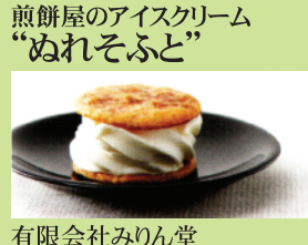
有限会社みりん堂