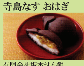
有限会社坂本せん餅